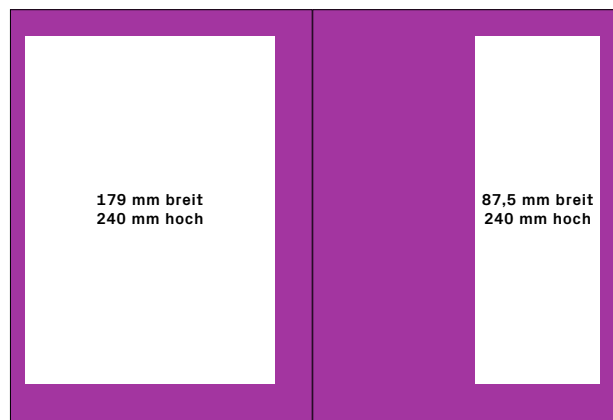
die ganze Seite, Satzspiegel