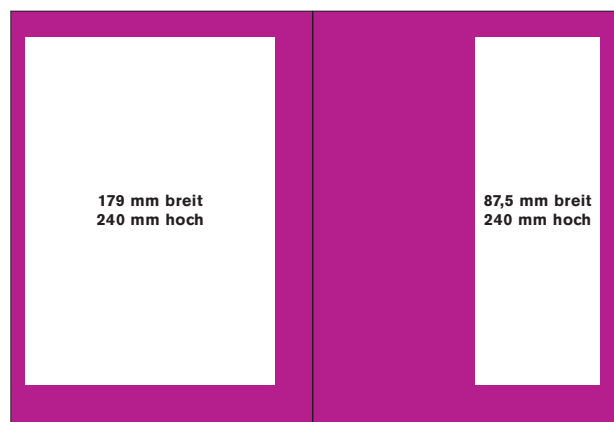
die ganze Seite, Satzspiegel