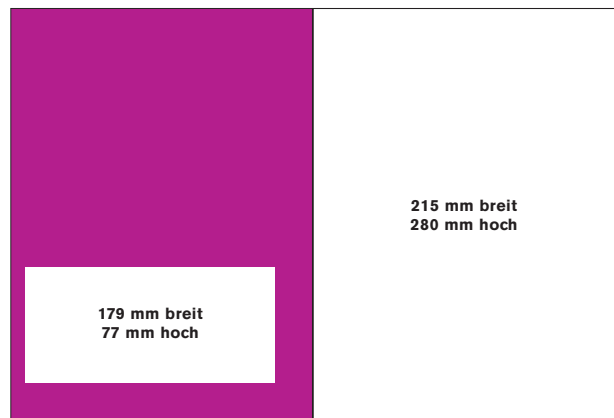
die 1/3 Seite quer